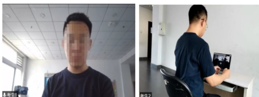
图 2 “双机位”镜头显示的考生画面