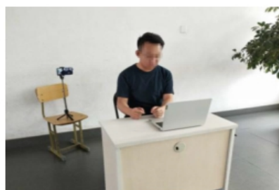
图 1 考生“双机位”设备摆放布置示意图