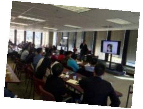
UC Berkeley 課程